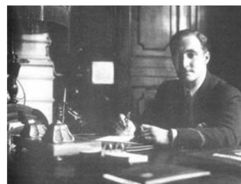
JOSE ANTONIO AGIRRE LEKUBE Lehendakari y Defensa