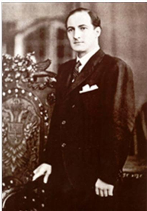
JOSE ANTONIO AGIRRE LEKUBE 1er. Lehendakari del Gobierno Vasco